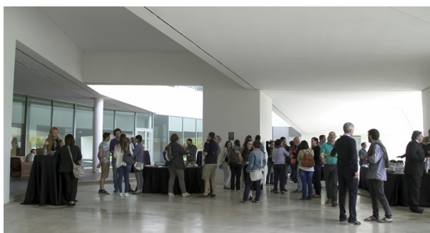
Imágenes de anteriores congresos del IVO en IMO Barcelona